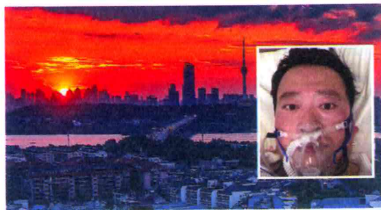
Li Wenliang, il medico che lanciò l'allarme coronavirus e fu costretto a ritrattare. Sullo sfondo la città di Wuhan.