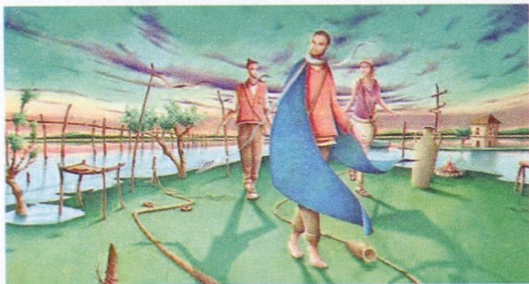
Particolare del poster preparato per la "giornata" dall'Ufficio Nazionale della CEI per la pastorale delle vocazioni.

Signore Gesù, seguire te è far sbocciare sogni e prendere decisioni: è darsi al meglio della vita. Attracci all'incontro con te e chiamaci a seguirti per ricevere da te il regalo della vocazione: crescere, maturare e divenire dono per gli altri. Amen.